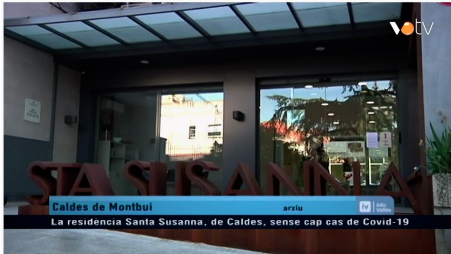
VOTV - La residència Santa Susanna, de Caldes, sense cap cas de Covid-19

MIRA-HO A: https://www.youtube.com/watch?v=7_1A16aJckc&list=PLhQw0aB82aO11Ou3kRenSSTLITvbvHaMO