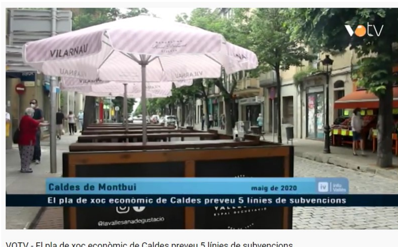
VOTV - El pla de xoc econòmic de Caldes preveu 5 línies de subvencions

Enllaç: https://www.youtube.com/watch?v=2a_wkeNET2E&list=PLhQw0aB82aO11Ou3kRenSSTLITvbvHaMO&index=5