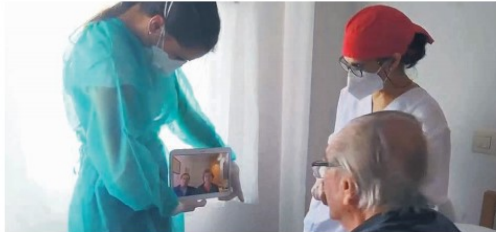
Els donatius recaptats es destinaran a atenuar la situació econòmica que ha causat el coronavirus a la fundació calderina.

La Fundació Santa Susanna d'adhereix al #GivingTuesdayNow per demanar la col·laboració dels vilatans i així fer front als efectes econòmics de la crisi sanitària