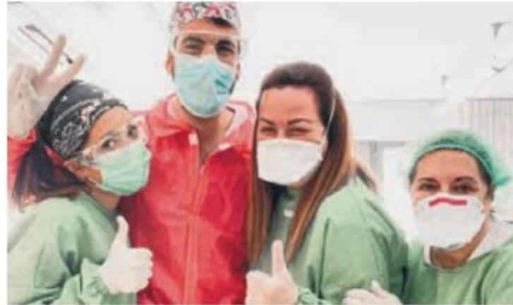
Els professionals de la Fundació han fet un gran esforç

La Fundació d'Acollida Santa Susanna ha comunicat que ja és una "residència verda" o, cosa que és el mateix, que està lliure de casos de Covid-19 després dels resultats dels segons tests PCR realitzats a tots els seus residents. El passat 13 de maig, l'organització Open Arms, va repetir les proves que detecten la malaltia del coronavirus als 22 residents que el mes d'abril van donar positiu i també als residents que tot i tenir un test amb resultat negatiu, havien tingut contacte amb casos positius. Amb aquesta bona notícia, la Fundació enceta una nova fase, on continua aplicant les mesures de prevenció i de seguretat per protegir la salut de les persones usuàries del centre. S'hi han implementat noves mesures que afecten els circuits de bugaderia i de cuina i també s'han realitzat formacions als equips de treballadors i treballadores per donar a conèixer els diferents canvis organitzatius. Tanmateix, la Fundació Sociosanitària Santa Susanna manté el seu suport per reforçar l'atenció assistencial i la coordinació amb el CAP del municipi.